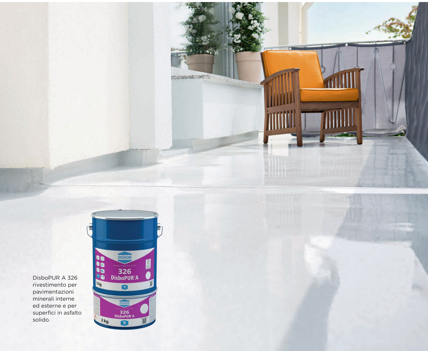
DisboPUR A 326 rivestimento per pavimentazioni minerali interne ed esterne e per superfici in asfalto solido.

Per qualunque progetto Disbon può vantare infatti oltre 60 anni di esperienza nella ricerca, nello sviluppo e nella commercializzazione di sistemi di prodotti per la protezione degli edifici, un fattore spesso decisivo per il successo dei lavori di risanamento. A questo fine i professionisti possono contare sul servizio di consulenza di Disbon fin dalla fase di progettazione.